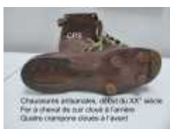
barrette en fer à cheval à l'arrière

Pour visualiser les images, soit on laisse la souris posée sur la ligne des vignettes (après un p'tit temps de chargement), soit on clique sur la grande image