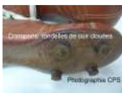
crampons cloués (détail)