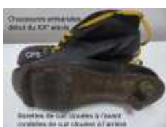
Barrettes clouées à l'avant