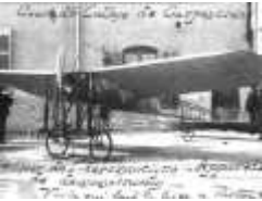
avion de démonstration cour du collège - copie