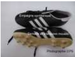
semelle moulée, empoigne synthétique