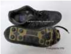
semelles et crampons moulés