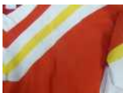
maillot RCC jersey