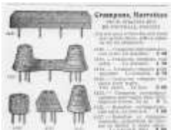
crampons williams 1924

Un extrait du catalogue d'article de sport 1924 de la maison Williams