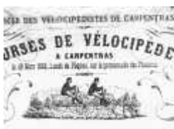
courses cyclistes de Mars 1869

1982 - Tour du Vaucluse, Eric Caritoux franchit la ligne d'arrivée (Chalet Reynard), L.Fignon est second.