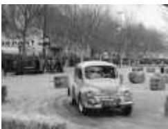
Le gymkhana du rallye de la lavande - 1958

Pour visualiser les photos, cliquer sur la lè affichée ou sur les vignettes qui défilent