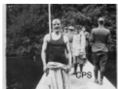
Jeux inter-alliés - 30 juin 1919

L'escalier extérieur était accessible de la rue. Espace intermédiaire il permettait de voir le bassin et les nageurs sans entrer dans l'établissement.