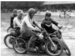
1962- Derby de Motoball Racer Carpentras- MB Camaret

Une 4cv Renault lors du gymkhana. Allées des platanes à Carpentras.