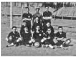
Les diables noirs - 1936

Avant la réalisation du "Parc des sports" le FCC joua quelques saisons au stade de la Roseiraie qu'il partagea, non sans quelques frictions, avec le club de Rugby. Roger Piantoni était le capitaine-entraîneur du FCC.