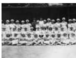
Fémina Sport: un club de pionnières

La première aviatrice à avoir obtenu son brevet. 1910