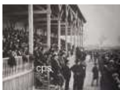
1922 inauguration du Stade St Ruf (Avignon)

Une structure "tout en bois" qui sera modifiée ultérieurement (toiture à structure métallique)