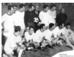
1966 Jean-Paul Belmondo et son équipe

Pour visualiser les photos, cliquer sur la lè affichée ou sur les vignettes qui défilent