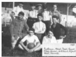
Collégiens carpentrassiens au stade de Villefranche.

Créé en 1934 pour accueillir les premiers match de moto-ball de l'AMCC. Il ne fut plus utilisé après le disparition de l'équipe en 1939. Les tribunes en bois étaient dangereusement légères.