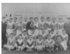
Les Arlequins au Stade de Villefranche

Pour visualiser les photos, cliquer sur la lè affichée ou sur les vignettes qui défilent