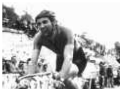
Caritoux vainqueur au Chalet Reynard

Pour visualiser les photos, cliquer sur la lè affichée ou sur les vignettes qui défilent