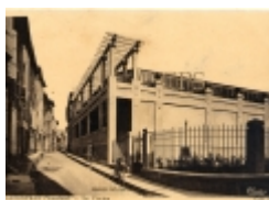
Piscine couverte: escalier extérieur

Initialement la façade Ouest de la piscine de Carpentras était ouverte et on pouvait y accéder par un escalier extérieur.