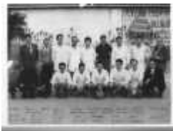
Le FCC en 1950

Un club de football Carpentrassien qui dura le temps d'une génération. Aucun club ne s'implanta durablement à Carpentras avant 1950.