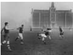
Football dans les brumes londonniennes.

Le Football Club Carpentrassien fut le premier club consacré au Football dont l'existence dépassa une dizaine d'année.