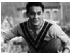
Puig Aubert, légende du Rugby à 13

1922 - Inauguration du Stade Saint Ruf. La quasi-totalité des tribunes des stades de l'époque étaient en bois. En Provence les tribunes étaient toujours adossées au Mistral. Du moins jusqu'à la construction regrettable du parc des sports d'avignon qui remplaça St Ruf.