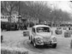
Le gymkhana du rallye de la lavande - 1958

Pour visualiser les photos, cliquer sur la lè affichée ou sur les vignettes qui défilent