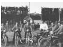
Porte d'entrée du stade de Villefranche

Comme pour la plupart des stades créés à cette époque les tribunes de St Ruf étaient entièrement en bois. Adossées au Mistral elles étaient très confortables en hiver, même si la visibilité était loin d'y être parfaite. Elles ont récemment été détruites par le feu.