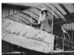
Raymonde de la Roche

Les adversaires du sport féminin faisaient flèche de tout bois et prétendaient que le sport rendait les femmes disgracieuses.