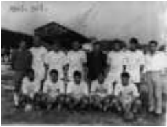
Le FCC au stade de la Roseiraie 1967/68

Avant la réalisation du "Parc des sports" le FCC joua quelques saisons au stade de la Roseiraie qu'il partagea, non sans quelques frictions, avec le club de Rugby. Roger Piantoni était le capitaine-entraîneur du FCC.