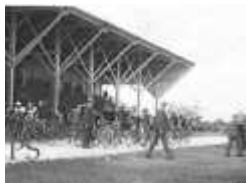
Tribunes du Stade Vélodrome Lombard à Cavillon

équipes se situaient sous les gradins de bois. En se rhabillant les juniors pouvaient suivre l'évolution du score des seniors en entendant le fracas provoqués par les spectateurs tapant des pieds sur les gradins.