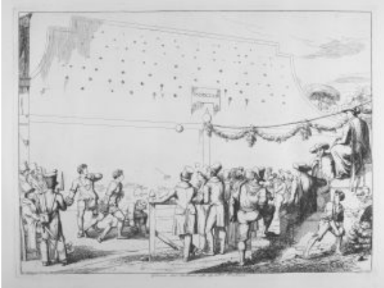
Fig. 4 : Gravure italienne représentant le jeu. En 1814, vraisemblablement à Rome, place des quatre fontaines.

fort longtemps. On en trouve la trace aux 14 e et 15 e siècles où il se pratiquait dans les rues et sur les places des villes italiennes. Aux 18 e et 19 e siècles (fig. 4) il deviendra le jeu le plus populaire d'Italie.