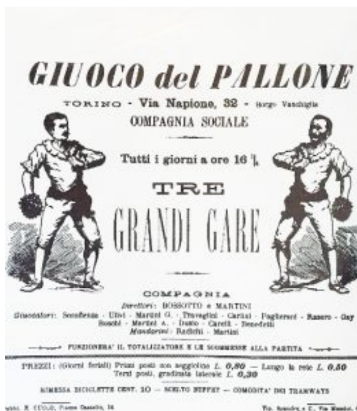
Fig. 3 : Affiche Turinoise du

En Italie depuis le 16e siècle au moins jusqu'à nos jours, on a pratiqué le « giuco del pallone » sous ce nom-9 et avec une continuité dont, je crois, il faut féliciter nos voisins italiens (fig. 3).