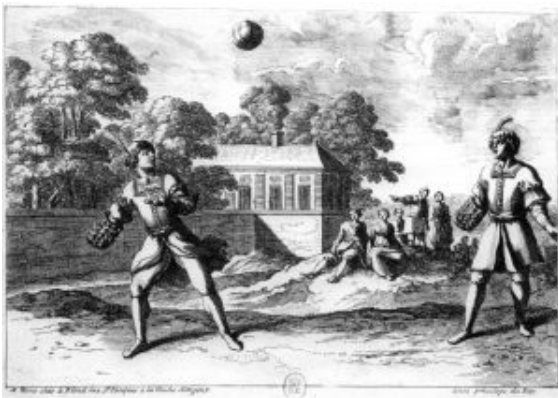
Fig. 6 : Gravure de J. Lepautre. 17e siècle. (BNF). La légende d'époque de la gravure est : Le ballon. Beaucoup d'auteurs pensent qu'à l'origine, étaient utilisés des ballons gonflés. Mais depuis longtemps on se sert

Donc, ce jeu ressemblait beaucoup au jeu de paume. Il ne s'agit pas d'une opinion personnelle puisque le grand ethnologue folkloriste Arnold Van Gennep pense que tous les jeux qui se jouent ainsi face à face, comme le « giuoco del pallone » ou le jeu de paume, sont des dérivés du jeu de « Trinquet »-13. Et une gravure du 17e siècle de Jean Lepautre (fig. 6) conservée à la bibliothèque nationale nous montre qu'en France aussi le même jeu était pratiqué de la même façon qu'en Italie. Et comme cette gravure est intitulée « le ballon » on comprendra que la distinction que nous faisons maintenant entre jeu de balle et jeu de ballon n'était pas si évidente que ça, même pour les contemporains de la gravure.