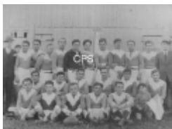
Les Arlequins au Stade de Villefranche

Pour visualiser les photos, cliquer sur la lè affichée ou sur les vignettes qui défilent