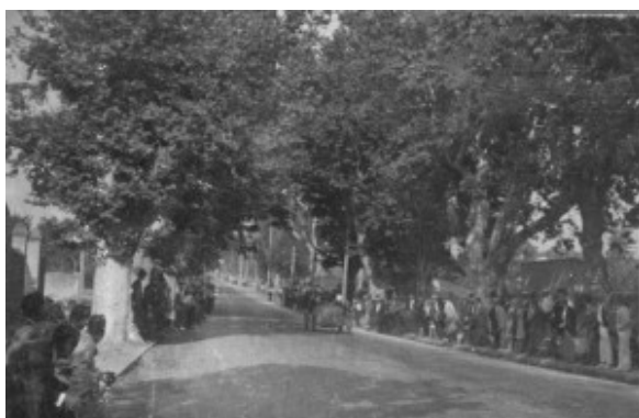
La foule au départ.

Un beau spectacle est fourni par les participants.