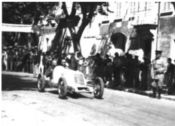
Départ en fumant la pipe.