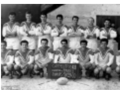
Une génération prolifique

Le public lors d'une AG du RCC. Tous les présents ont été ou seront membres du comité directeur. Les joueurs sont debout ou assis dans le fond de la salle.