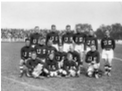
1919 équipe de rugby des USA

années 20. La photo semble montrer une "pelouse" en sable.