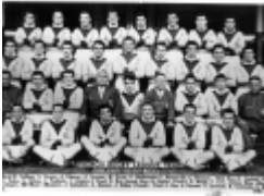
Equipe de France de Rugby à 13 - 1955

L'équipe de France de la tournée de 1955 en Australie et Nouvelle-Zelande. 19 victoires (dont 2 tests) pour 13 défaites