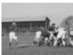
Carpentras, ancien stade de Villefranche

Les vestiaires de la Roseraie étaient situés sous les anciennes tribunes de bois. Ils ont été supprimés lorsque les tribunes ont été rénovées (1997).