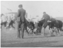
rugby à alger

Sixième rencontre amicale entre « l'Association Sportive de la banque de France » et celle tout aussi élégante de la « London Bank ». Il y eut trois épreuves : un match de Football-Association un match de Rugby et un cross-country.