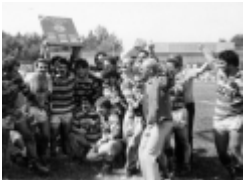
RCC Champion de France de DN2

L'équipe de France de la tournée de 1955 en Australie et Nouvelle-Zelande. 19 victoires (dont 2 tests) pour 13 défaites