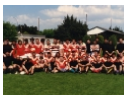
un match d'anciens du RCC en 1996

Un stade en bois achevé en 1923 et financé par souscription. Il ne fut utilisé qu'une dizaine d'année. Ici un match contre le SCUF en Février 1929.