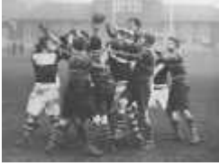
Banque de France Vs London Bank 1926

Sixième rencontre amicale entre « l'Association Sportive de la banque de France » et celle tout aussi élégante de la « London Bank ». Il y eut trois épreuves : un match de Football-Association un match de Rugby et un cross-country.