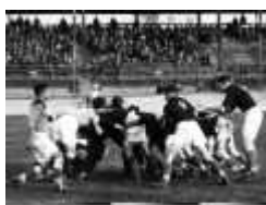
Match Italie- Littoral. Milan 1927

Une tradition festive de fin de saison: les matchs opposant les anciens et les nouveaux ou les joueurs et les dirigeants.