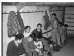
Stade de la Roseraie, vestiaire.

Les anciennes tribunes en bois du stade de la Roseraie peu de temps avant leur remplacement. Match RCC Vs SOA : la composition des équipes est bien visible sur le panneau.