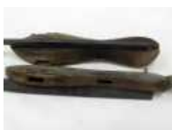
Patins fer et bois

Ce détail du triptyque des tentations de St Antoine par Jérôme Bosch, (Lisbonne, Museu Nacional de Arte Antiga) montre un bien curieux personnage. Bien que ce tableau ait été peint en 1502 semble bien que ce patineur cauchemardesque soit équipé de très anciens patins à semelle d'os.