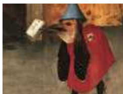
patineur Bosch lisbonne

Johannes Brugman consacra à Ste Lydwine en 1498. Cette image est probablement la première représentation de patins à lame de métal.