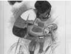
Taylor dessin - copie