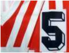
maillot rcc synthétique