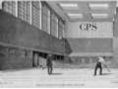
jeu de paume CPS 1