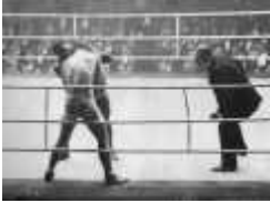
Georges Carpentier contre Joe Jeannette 1914

Pour visualiser les photos, cliquer sur la lè affichée ou sur les vignettes qui défilent