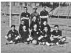
Les diables noirs - 1936

Avant la réalisation du "Parc des sports" le FCC joua quelques saisons au stade de la Roseiraie qu'il partagea, non sans quelques frictions, avec le club de Rugby. Roger Piantoni était le capitaine-entraîneur du FCC.