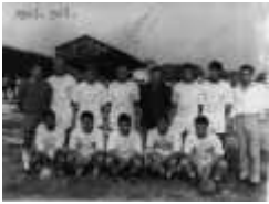
Le FCC au stade de la Roseraie 1967/68

Avant la réalisation du "Parc des sports" le FCC joua quelques saisons au stade de la Roseraie qu'il partagea, non sans quelques frictions, avec le club de Rugby. Roger Piantoni était le capitaine-entraîneur du FCC.