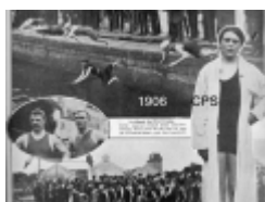
1906 Championnat du monde de natation - Prix Fémina

Les épreuves de natation eurent lieu au lac St James dans le bois de Boulogne. Le Français Lourmer vainqueur du 200m brasse