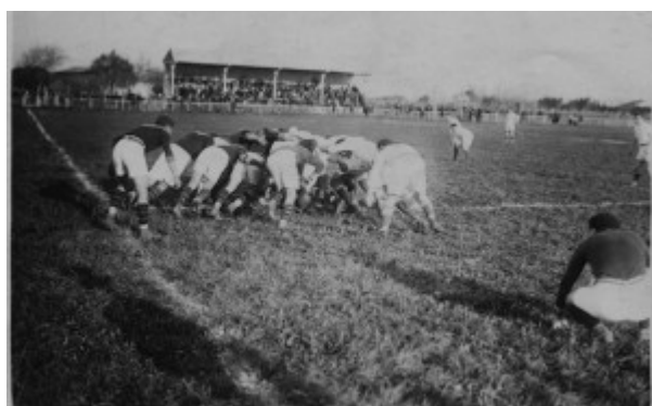
Match Carpentras-Chateaubrenard 1924

Ces couvre-chefs sont alors portés avec leurs insignes métalliques régimentaires et de la même façon qu'ils étaient portés en uniforme. De même sur les photos des grands clubs, on pouvait voir les internationaux poser à la mode britannique avec la « cap » des équipes nationales sur la tête. Il s'agissait alors d'ornements et il n'était manifestement pas question de jouer avec. Mais quatre ou cinq ans plus tard, autour de 1925, on voit des joueurs poser avec des bérets plus petits que les bérets militaires complètement enfoncés jusqu'aux oreilles. Et ce qui est beaucoup plus inattendu c'est que les photographies des matchs montrent que les joueurs portaient leurs bérets pendant la partie. Sur des comptages nécessairement approximatifs, car les photos n'ont pas souvent la netteté idéale, il nous a semblé qu'un tiers des joueurs environ faisait ainsi.