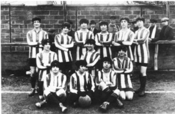
L'équipe de football du Fémina en 1920

En revanche au football, le béret ne paraît pas pouvoir présenter un quelconque intérêt technique. C'est même le contraire qui paraît évident puisque le jeu de tête devait y perdre beaucoup de précision. Cette mode a duré quelques années et toucha aussi les sports collectifs féminins. Il est même tout à fait possible que les joueuses de football du Fémina-sport aient été à l'origine de cet engouement.