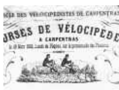
courses cyclistes de Mars 1869

1982 - Tour du Vaucluse, Eric Caritoux franchit la ligne d'arrivée (Chalet Reynard), L.Fignon est second.