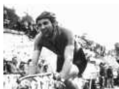
Caritoux vainqueur au Chalet Reynard

Pour visualiser les photos, cliquer sur la lè affichée ou sur les vignettes qui défilent